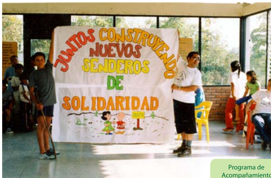
Programa de Acompañamiento a Grupos

Una de las actividades que más reconocimiento tiene en el PPT son los campamentos. Espacios donde se aprende, se juega y se divierten niños, jóvenes y adultos; pues el juego y la diversión hacen parte de la dinámica organizacional de los grupos, como elementos que aportan a la cohesión entre los participantes de la organización (NAT's, JOT's, adultos y acompañantes). El espacio está construido con el objetivo de integrar en un mismo escenario, a un colectivo de personas con el fin de dar cumplimiento a unos propósitos concertados con anterioridad, como el de planificar los procesos, evaluarlos y promover la integración o la construcción de nuevas propuestas.