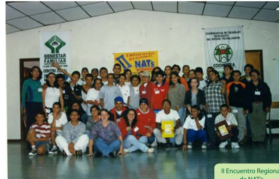
II Encuentro Regional de NAT's

La vinculación al movimiento latinoamericano de NAT's exigía la proyección de un movimiento en Colombia. De este modo, en los años noventa se iniciaron una serie de encuentros con otras organizaciones para animarlas a que se unieran a esta utopía, como se leía en este tiempo. Los niños, las niñas y los adolescentes a partir de la lectura crítica de su contexto, organizaron encuentros regionales y nacionales, intercambiaron experiencias y promovieron acciones encaminadas a la promoción y a la defensa de sus derechos; como evidencia de este proceso encontramos en la revista palabras de Nat's : " Los NAT's tenemos derecho a la libre expresión, a ser escuchados, a la vida, a la educación, a la seguridad social, a la recreación, al buen trato, a nuestra sexualidad, a la privacidad. Sin embargo, pensamos que nuestros derechos no se cumplen. Queremos que estos derechos no sólo estén escritos. " 49 Este proceso organizativo incentivó una participación crítica, capaz de generar acuerdos para la toma de decisiones, mejorar la capacidad de los actores para responder a las necesidades