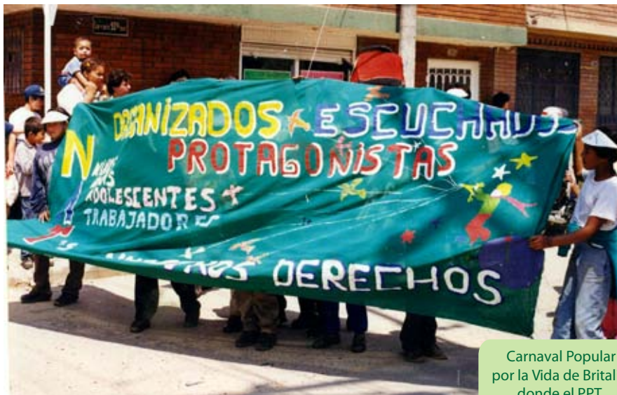
Carnaval Popular por la Vida de Britalia donde el PPT participó

Simultáneamente con los inicios del PPT en Patio Bonito, en Latinoamérica se construía y se entretrejía un movimiento de niños, niñas y adolescentes trabajadores desde la experiencia del MANTHOC, 47 en donde no sólo se promovía la organización de los NAT's al interior del Perú, sino en las distintas organizaciones de NAT's en Latinoamérica y el Caribe (LAC), para que se unieran en una apuesta colectiva por la promoción del protagonismo y la organización de los NAT's. Las "Buenas Nuevas" que venían encajaban de manera armónica con los procesos que se estaban construyendo dentro del PPT, aquí no se hablaba de Valoración Crítica, ni de protagonismo, pero se construían espacios que aportaran a la mejora de las condiciones de vida de las niñas y de los niños, trabajadores desde una experiencia de fe y de autoestima, en donde se resignificaba la labor del niño que estaba detrás del bulto, de la caja de helados, del martillo, de las verduras, del zorro, del canasto de empanadas, y del cuidado de sus hermanos. Esta valoración se cobijaba bajo el lema "El Pequeño es un Gran Trabajador".