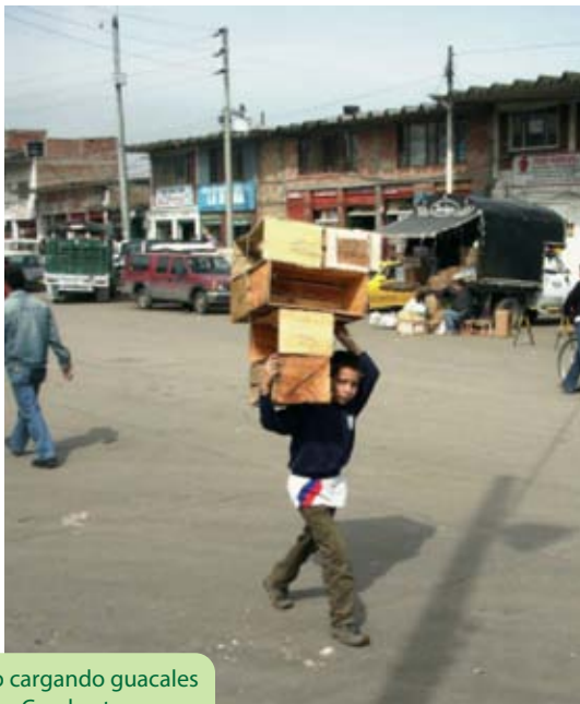
Niño cargando guacales Corabastos Bototá/Colombia