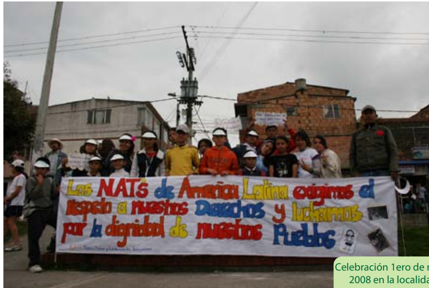
Celebración 1ero de mayo 2008 en la localidad de Usme

Mientras que en Colombia se forjaba el proceso nacional, en otros escenarios internacionales se gestaban las primeras reuniones intercontinentales desde el movimiento Latinoamericano de NAT's (MOLACNAT'S):