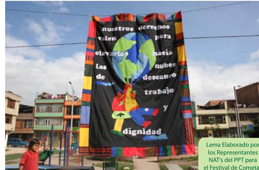
Lema Elaborado por los Representantes NAT's del PPT para el Festival de Cometas