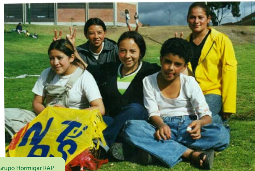
Grupo Hormigar RAP en el Festival de Cometas