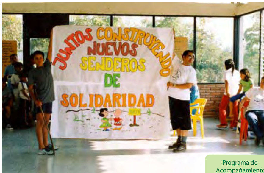
Programa de Acompañamiento a Grupos

Una de las actividades que más reconocimiento tiene en el PPT son los campamentos. Espacios donde se aprende, se juega y se divierten niños, jóvenes y adultos; pues el juego y la diversión hacen parte de la dinámica organizacional de los grupos, como elementos que aportan a la cohesión entre los participantes de la organización (NAT´s, JOT´s, adultos y acompañantes). El espacio está construido con el objetivo de integrar en un mismo escenario, a un colectivo de personas con el fin de dar cumplimiento a unos propósitos concertados con anterioridad, como el de planificar los procesos, evaluarlos y promover la integración o la construcción de nuevas propuestas.