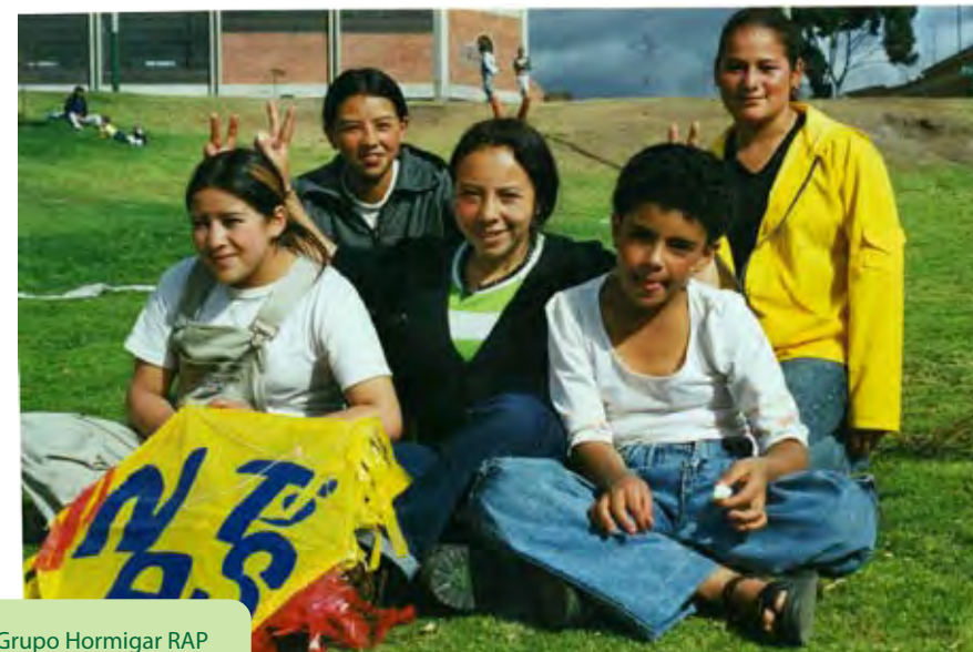
Grupo Hormigar RAP en el Festival de Cometas

“Con frecuencia uno se olvida de ser niño, de todo aquello que sentía cuando era pequeño. Por esto decimos que, si el niño puede expresar su propia opinión y ser escuchado, siempre tiene algo importante que decir” (A. Díaz, entrevista, 2004)