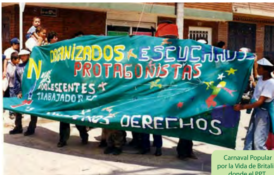
Carnaval Popular por la Vida de Britalia donde el PPT participó