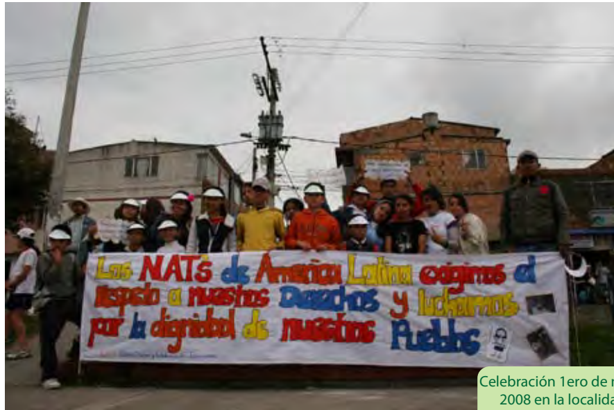
Celebración 1ero de mayo 2008 en la localidad de Usme

Mientras que en Colombia se forjaba el proceso nacional, en otros escenarios internacionales se gestaban las primeras reuniones intercontinentales desde el movimiento Latinoamericano de NAT's (MOLACNAT'S):