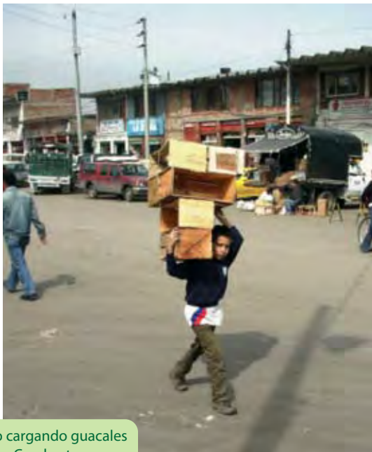
Niño cargando guacales Corabastos Bototá/Colombia